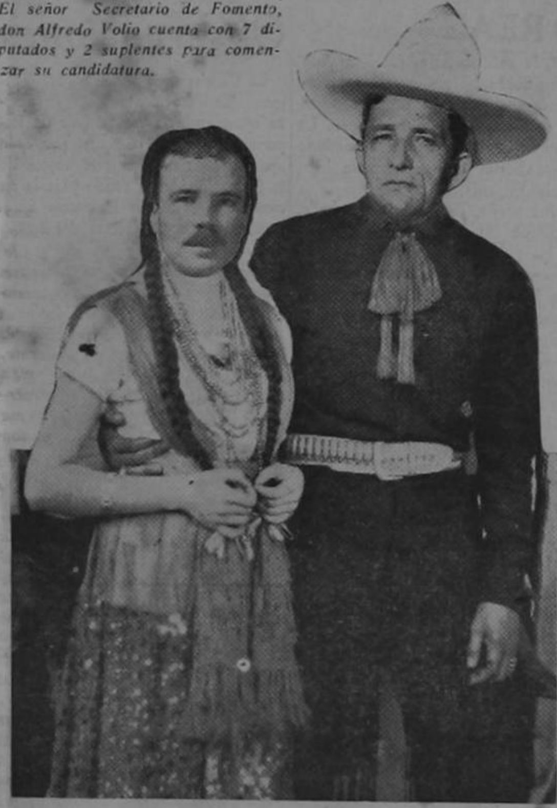
VOLIO: Las lumbres que yo he prendido no las apaga cualquiera. CORTES: Yo conozco caporales que se queman en la hoguera...