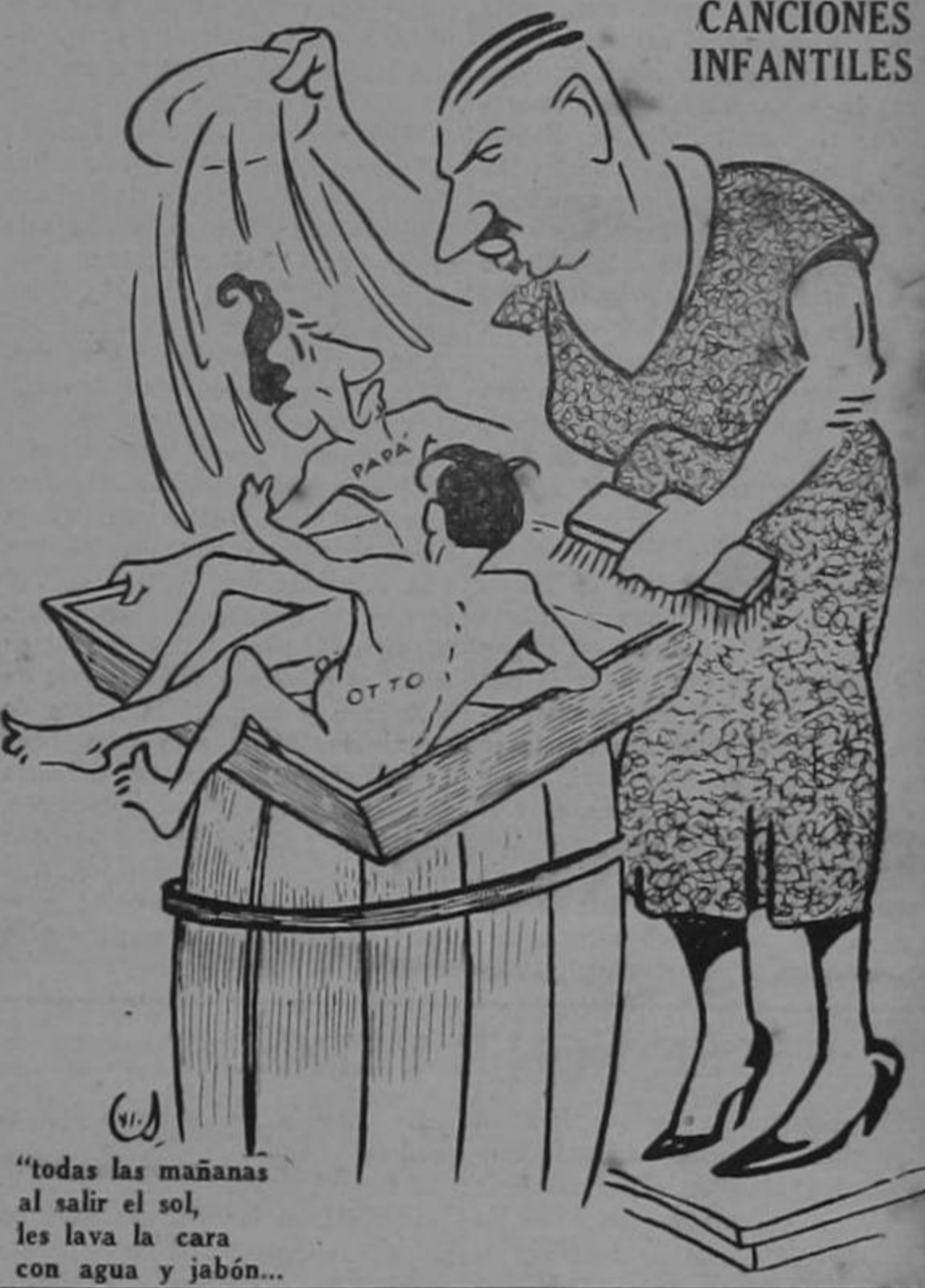
"todas las mañanas al salir el sol, les lava la cara con agua y jabón..."