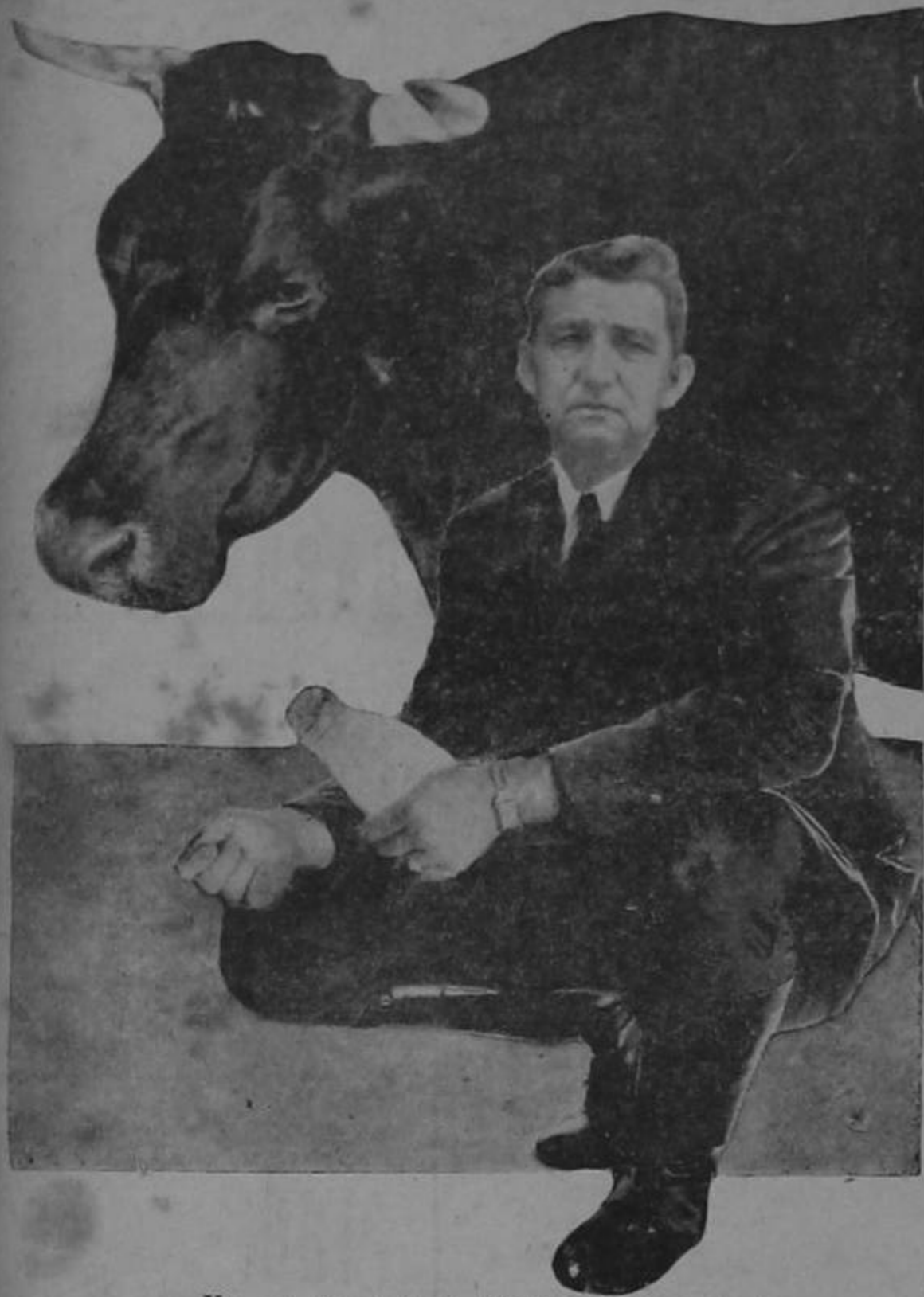
—Ya no tengo tanta "leche" como antes...!